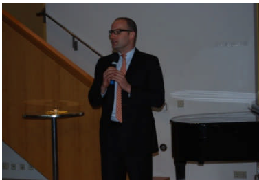
Das mittlerweile siebte Sommerfest konnte der Verein am 17. Juni 2010 in Berlin ausrichten. Die Veranstaltung, an der Vertreter aus Politik, Wirtschaft, Medien und Gesellschaft teilnahmen, die aus dem Münsterland stammen oder sich dem Münsterland verbunden fühlen, war wie in den vergangenen Jahren ein voller Erfolg. Über 150 Personen waren an diesem Abend zu Gast in der Katholischen Akademie in Berlin.

Dabei wurde insbesondere versucht, die Tradition, Lebensweise und Kultur des Münsterlandes und seiner Bürger im vorparlamentarischen und parlamentarischen Raum bekannt zu machen und zu fördern, sowie die Bekanntmachung und Förderung des traditionellen Brauchtums und der kulturellen Gepflogenheiten des Münsterlandes zu unterstützen. Durch die durchgeführten Veranstaltungen hat der Verein auch zur Pflege der Kontakte der Bürger, Förderer und Mitglieder in Berlin beigetragen.